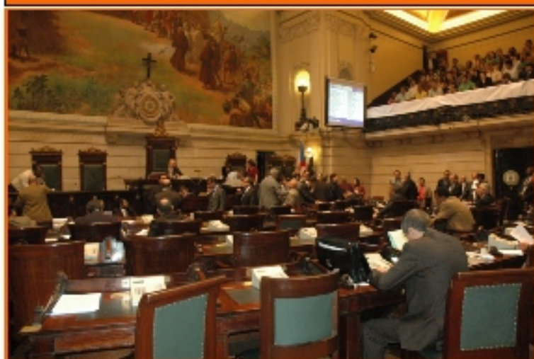
Plenário durante a votação do PL1005/2011