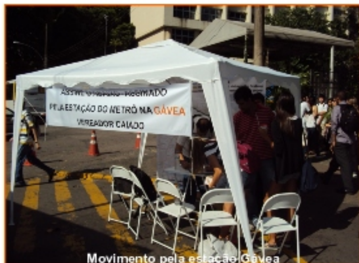
Movimento pela estação Gávea