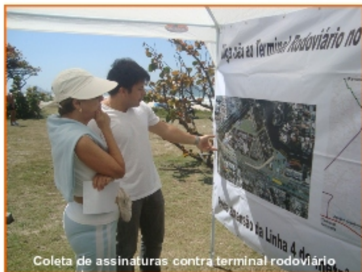
Coleta de assinaturas contra terminal rodoviário