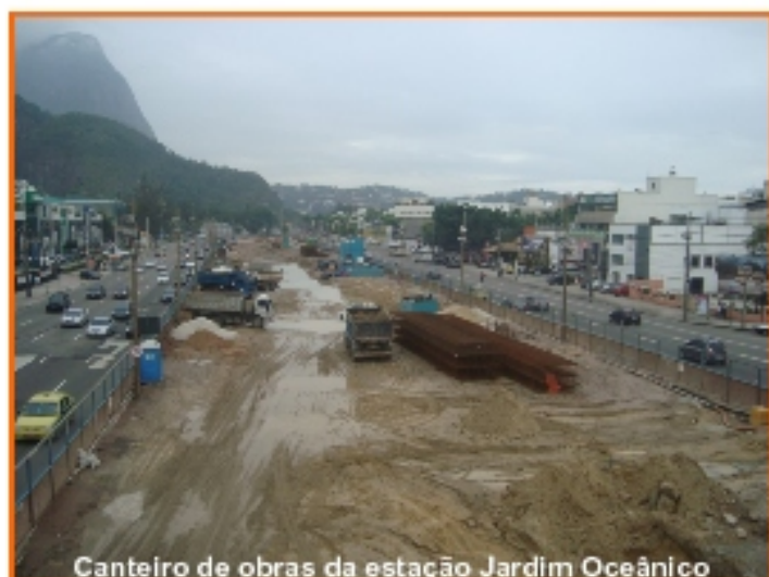
Canteiro de obras da estação Jardim Oceânico