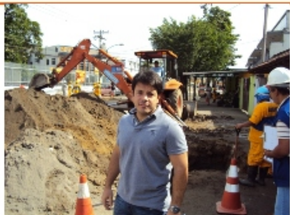
Visitando obras de saneamento na Zona Oeste

Em defesa da vida Pelo projeto original da Linha 4 do Metrô Jornada Mundial da Juventude Católica 2013