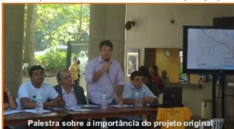
Palestra sobre a importância do projeto original